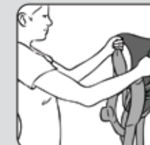
Figure 1—Figura 1