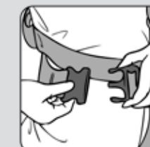
Figure 3—Figura 3