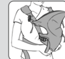
Figure 11—Figura 11

Cómo colocar al bebé en el Triple Comfort Rider®. Posición en la cadera