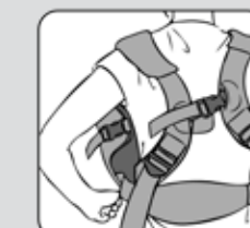
Figure 12—Figura 12