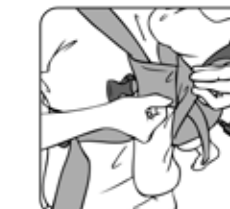
Figure 6—Figura 6