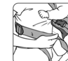
Figure 7—Figura 7