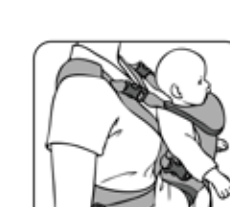
Figure 10—Figura 10