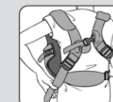
Figure 13—Figura 13