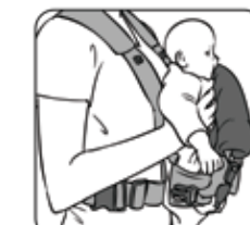
Figure 9—Figura 9

Cómo colocar al bebé en el Triple Comfort Rider®. Mirando hacia fuera