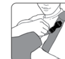
Figure 8—Figura 8