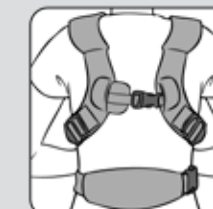
Figure 4—Figura 4