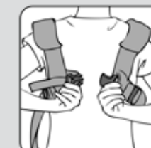
Figure 2—Figura 2