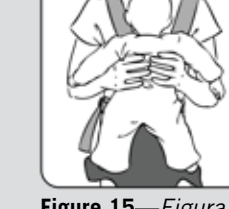
Figure 15—Figura 15