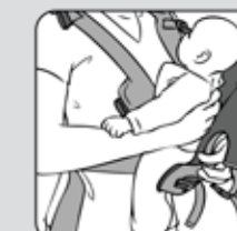
Figure 5—Figura 5

Cómo colocar al bebé en el Triple Comfort Rider®. Mirando hacia dentro